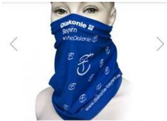
Multifunktionstuch blau /werden im Herbst wieder hergestellt